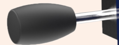
Système Fluido Compact N° art. : 650000

Pince facile d'emploi pour un large choix de positionnements.