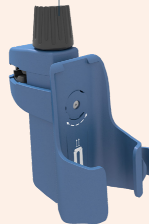
Support pour module de réchauffement Fluido Compact Réf. art. : 660700

Le support du module de réchauffement vous permet de placer le module de réchauffement près du patient sans risques.