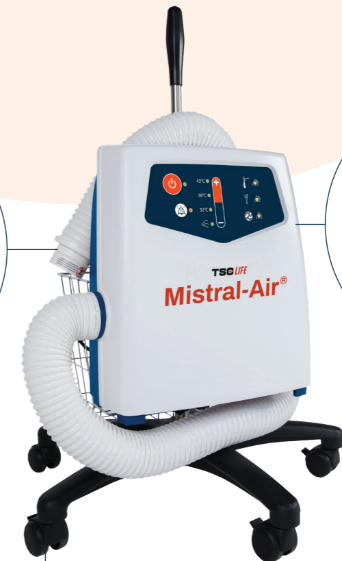
Unité de réchauffement Mistral-Air N° art. MA1200-EU

Le dispositif Mistral-Air est convivial et vous permet d'obtenir la bonne température de réchauffement d'un seul appui sur un bouton.